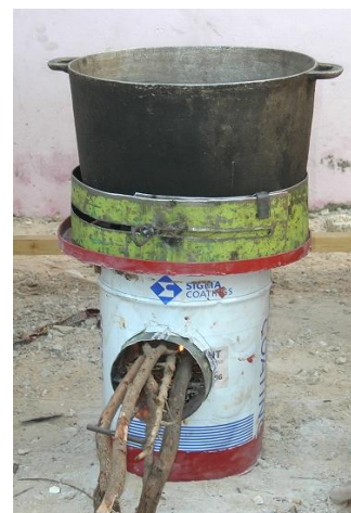
Mission au Sénégal, novembre 2009